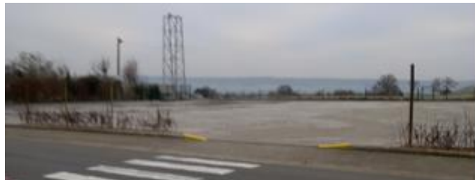
La nouvelle « Place St Brice » (parking en klinkers de la salle)

19.11.2024 Le vent a soufflé à Hombourg(après la pluie)