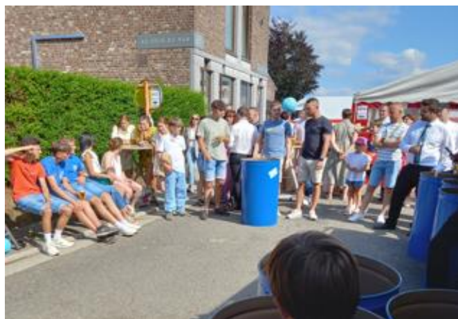
Le volley-pong du dimanche après-midi

le volley-pong du dimanche après-midi fut moins populaire mais animé.