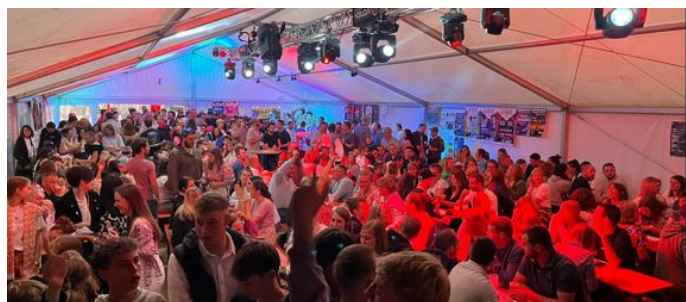
400 convives au barbecue de la kermesse . Un beau succès

Les soirées ont eu du succès , le jogging aussi, le barbecue a atteint les 400 couverts,