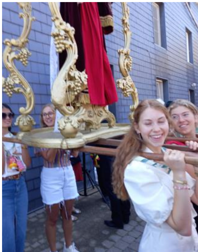
procession à la ferme Geelen. L'émancipation féminine en marche

-26 au 30-7.2024 Kermesse de Hombourg . 2 ème édition de la kermesse organisée en commun. Beau succès de foule. La procession est allée pour la première fois par le RAVEL depuis Pley vers Laschet avec reposoir à l'ancienne maison du garde-barrière et à la ferme Geelen à la Laschet puis retour au village